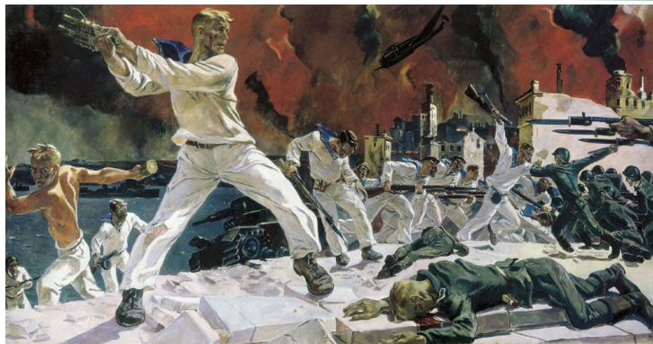
Дейнека А.А. Оборона Севастополя. 1942 г.