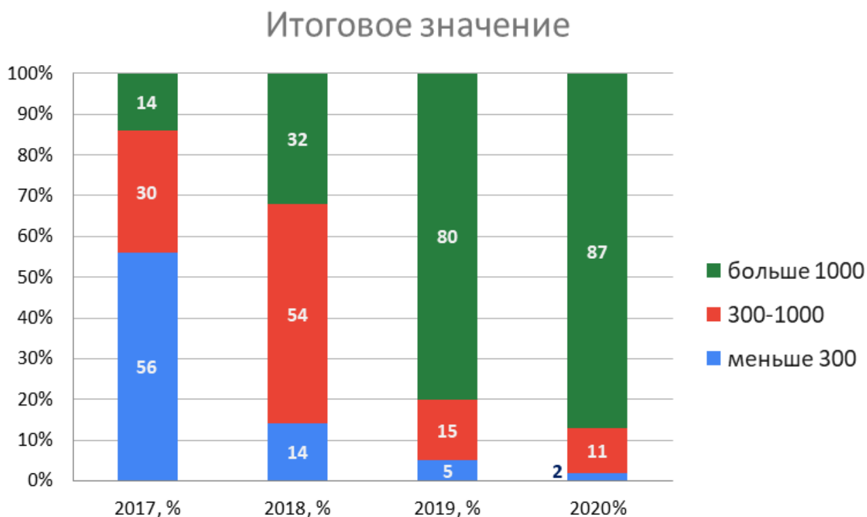
Рис. Динамика распределения итоговых показателей по кафедрам за четыре года